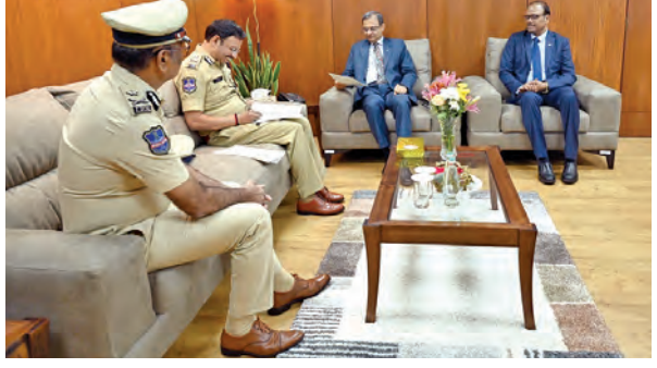
సైబర్ నేరగాళ్లకు సహకరిస్తున్న బ్యాంకుల అధికారులపై చర్యలు తీసుకోవాలి విషయంపై ఆర్బిఐ గవర్నర్ సంజయ్ మల్హోత్రాతో మాట్లాడుతున్న సీటీకొత్వాల్ సజ్జనార్. చిత్రంలో క్రైం అండ్ సీటీ అడవన్సు సీ ట్రీనివాస్

హైదరాబాద్, ఏప్రిల్ 21, ప్రభాతవార్త: దేశ వ్యాప్తంగా పెరిగిపోతున్న సైబర్ నేరాలలో నేరగాళ్లకు, మ్యూల్లీ భాత్యాలకు సహకరిస్తున్న బ్యాంకుల సిబ్బందిపై చర్యలు తీసుకోవాలని సీటీకొత్వాల్ సజ్జనార్ ఆరోపించారు. గవర్నర్ సంజయ్ మల్హోత్రాను కోరారు. ఐటీ విషయంపై చర్చించేందుకు సజ్జనార్ మంగళవారం సంజయ్ మల్హోత్రాను నగరంలోని ఆర్బిఐ కార్యాలయంలో భేటీ అయ్యారు. కమిషనర్ వెంబు నగర్ అదనపు పోలీసు కమిషనర్ (గ్రేండ్ అండ్ సీటీ) శ్రీనివాస్ కూడా పున్నారు. ఈ సందర్భంగా సైబర్ నేరాల పేరున, మ్యూల్లీ భాత్యాలకు సహకారం చేసే బ్యాంకులకు చర్యలు తీసుకోవాలని సీటీకొత్వాల్ సజ్జనార్ కోరారు. ప్రైవేటు బ్యాంకుల్లో ఇలాంటి నేరాలకు అమానుకుల పేర్లతో బ్యాంకుల్లో నేరగాళ్లు భాత్యాలు తెరుస్తుండగా వీటికి అక్కడి అధికారులు, సిబ్బంది సహా కరివడం సర్దిది కాదని సజ్జనార్ ఆరోపించారు. బ్యాంకులకు తెరుస్తున్న సమస్యలతో కెస్సెసి దృవీకారాలు సంబంధించి జరుగుతున్న ఆక్షేపాలు, నిరర్థకం గురించి సజ్జనార్ ఆరోపించారు.